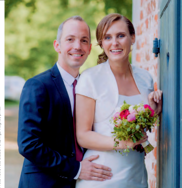
Gestaltung: Petra von Seggern